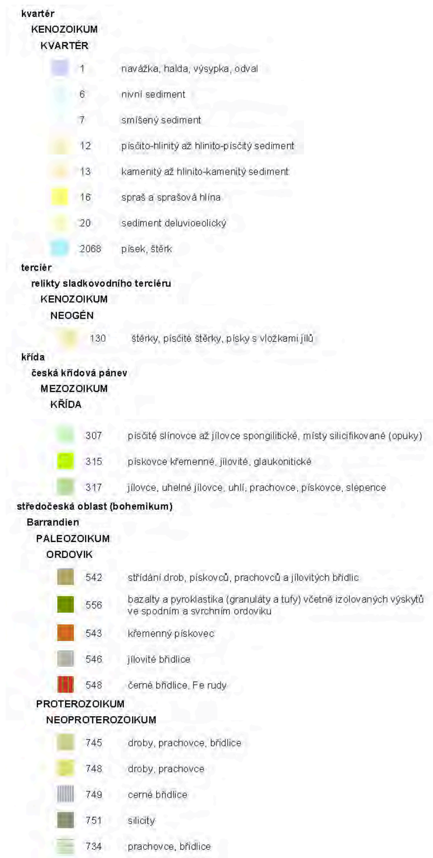
Obr. 1 – geologická mapa širšího zájmového území včetně legendy